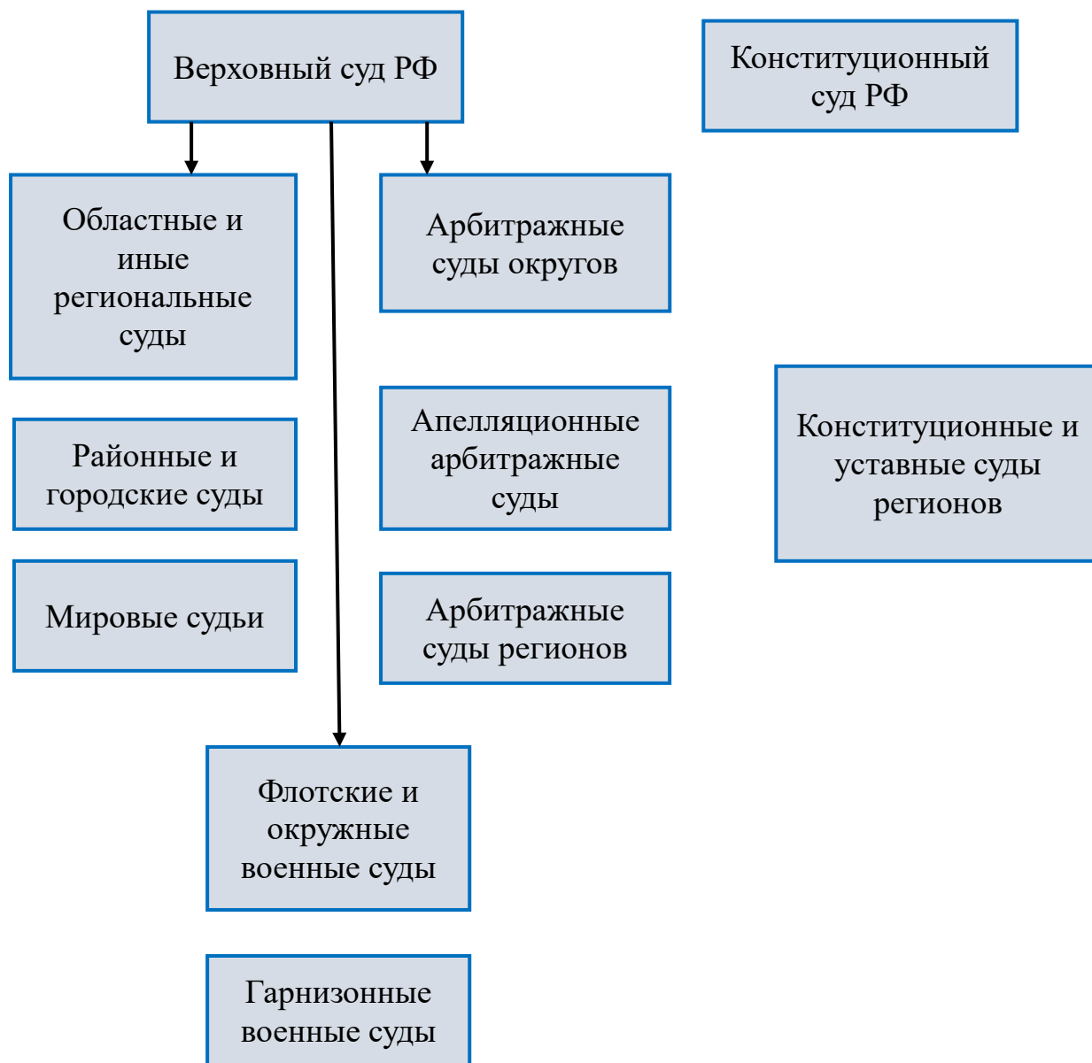
Рис. 4.1. Судебная система России

субъектов Российской Федерации. Создание чрезвычайных судов не допускается (ст.118).